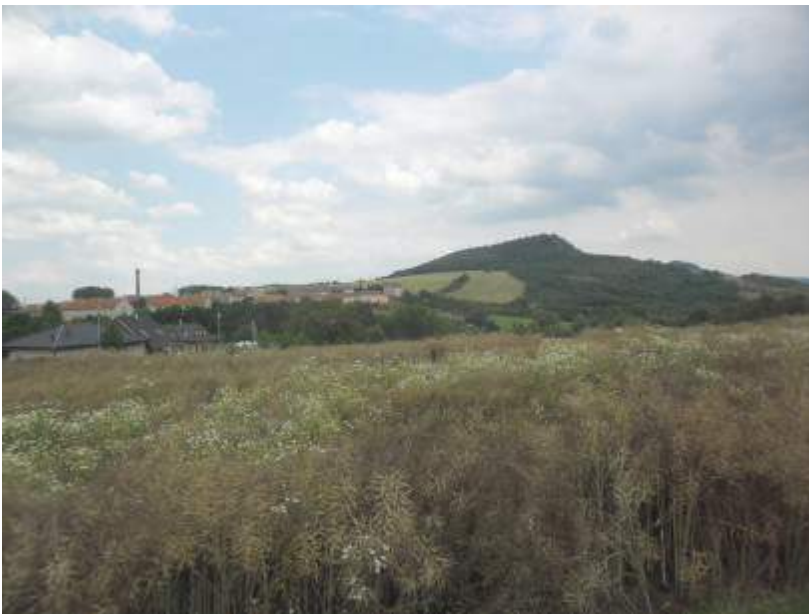
Landschaft in Tschechien