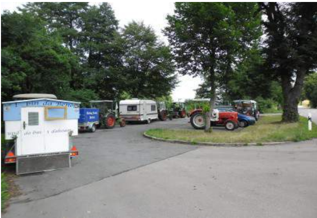
Am Parkplatz bei Nabburg fanden wir ein gemütliches Plätzchen.