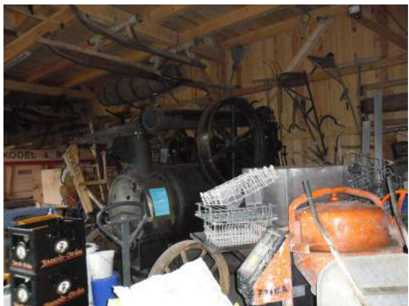
Eine fahrbare Dampfmaschine Baujahr 1908, 8 PS