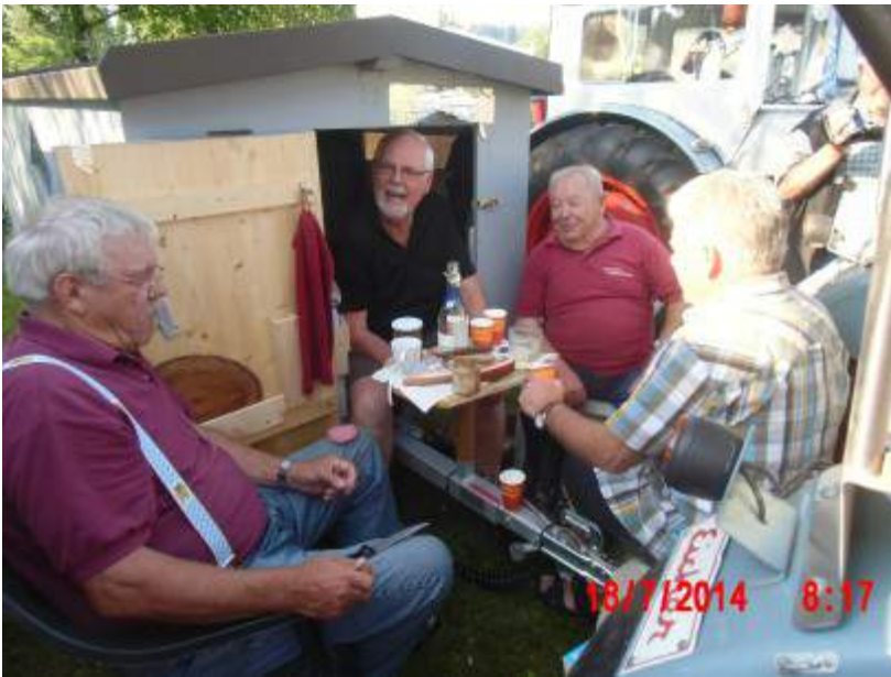
Auf dem Campingplatz in Vojetice in der Nähe von Susice