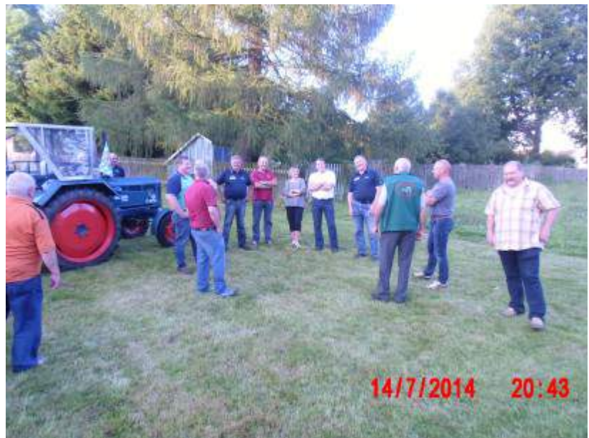
Bulldogbesichtigung mit den Oldtimerfreunden Berbersdorf