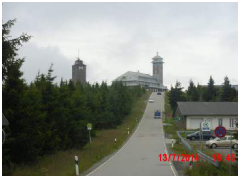
Auffahrt auf den Fichtelberg