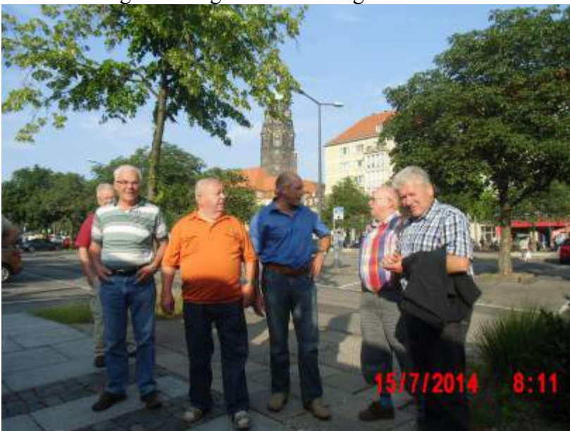
Ankunft in Dresden

Es war doch etwas anstrengend, so dass wir uns entschlossen, mit dem Bus um 15.45 Uhr von Dresden nach Pappendorf zurück zu fahren. In Pappendorf ließen wir es uns gut gehen, speisten wieder vorzüglich und genossen einen gemütlichen Abend.