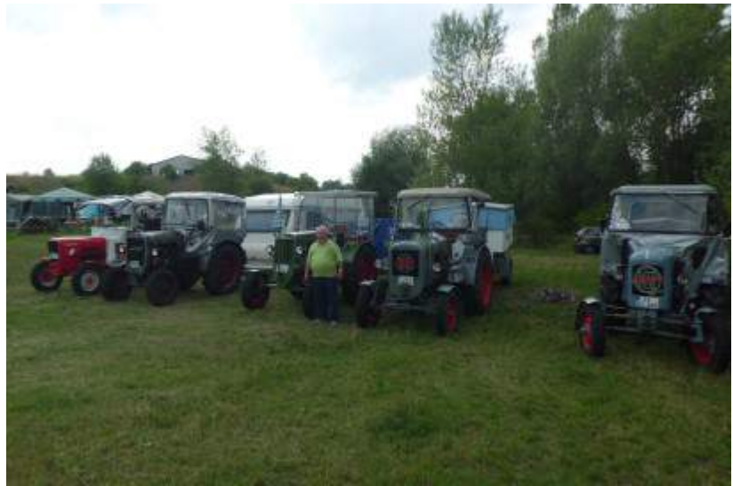
Auf dem Campingplatz am Nechanice-See