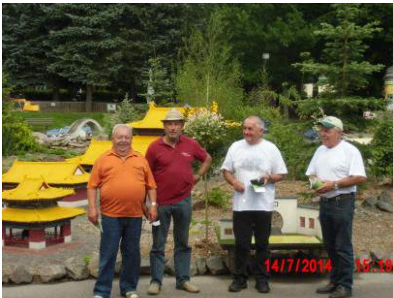
Der Miniaturpark Klein-Oederan