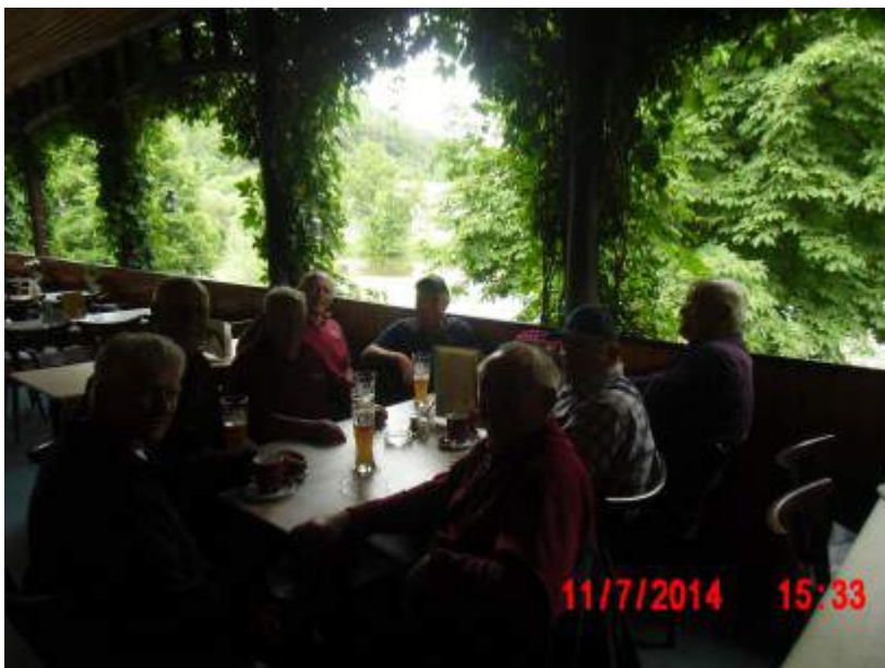
In der Klosterwirtschaft in Pielenhofen auf der Naabterrasse