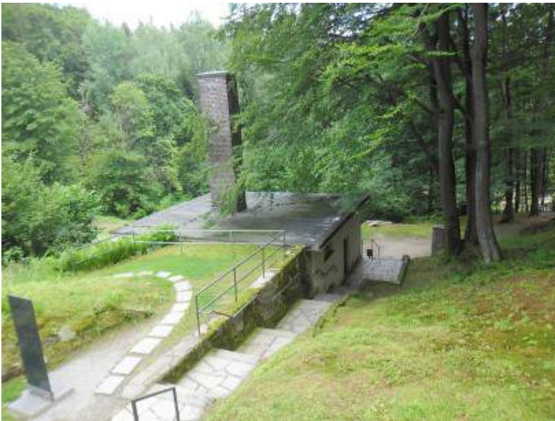
hier wurden die Menschen verbrannt