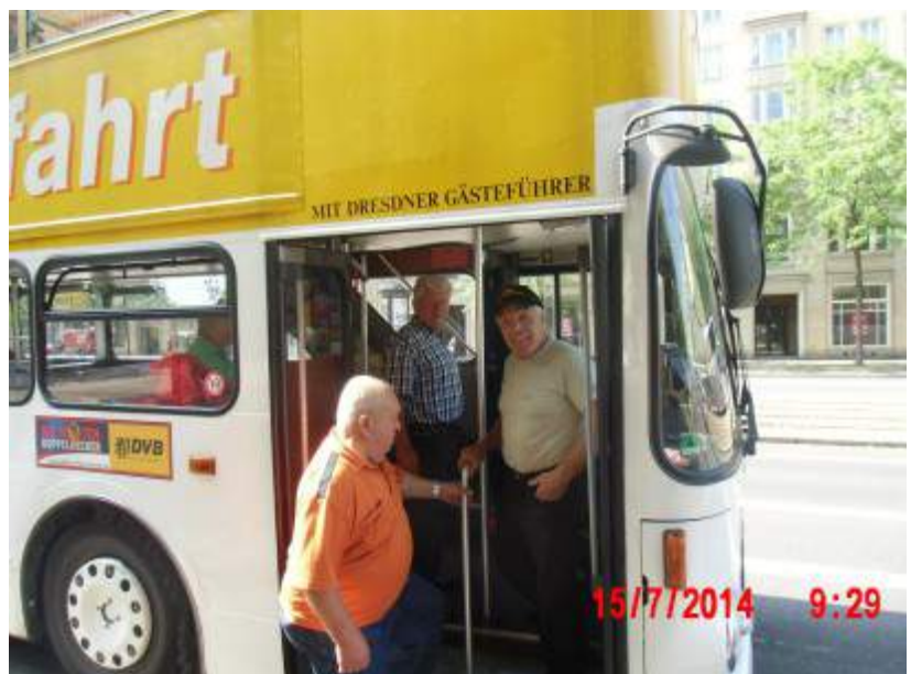
Auf geht's zur Stadtrundfahrt