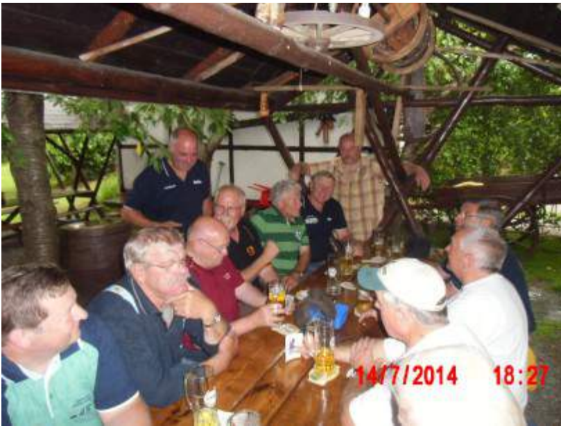
Im Biergarten der Bruschänke Pappendorf