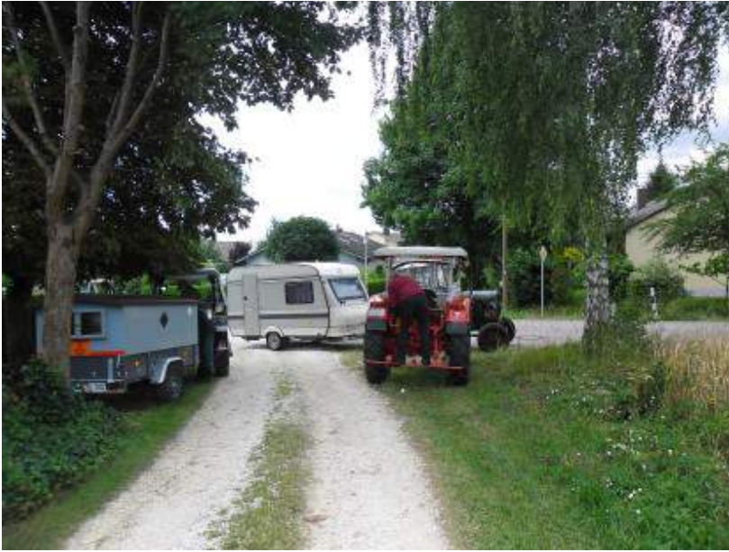
vor der Abfahrt