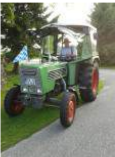
Lothar Pfaller, Schönbrunn Fendt 200 S, 40 PS, Baujahr 1981