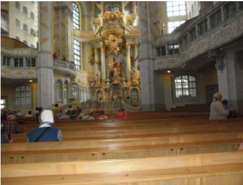
In der Frauenkirche