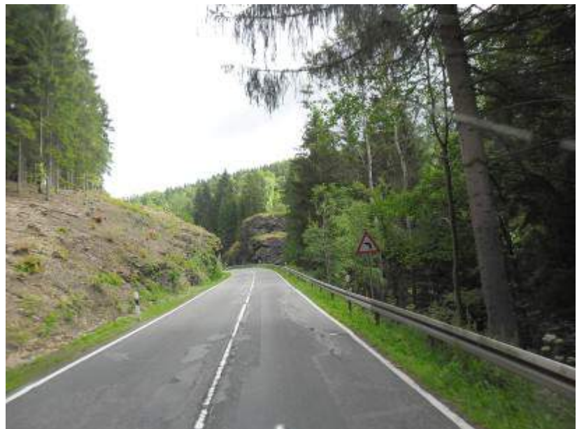
Fahrt durch das Erzgebirge