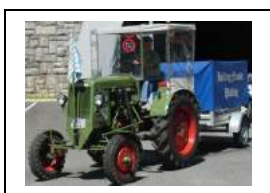
Hansl Fischberger Schlüter, 15 PS, Baujahr 1953