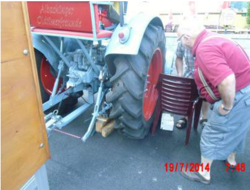
Das Rad musste abmontiert, der Schlauch geflickt werden.