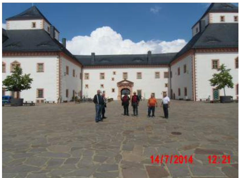
Besichtigung der Augustusburg