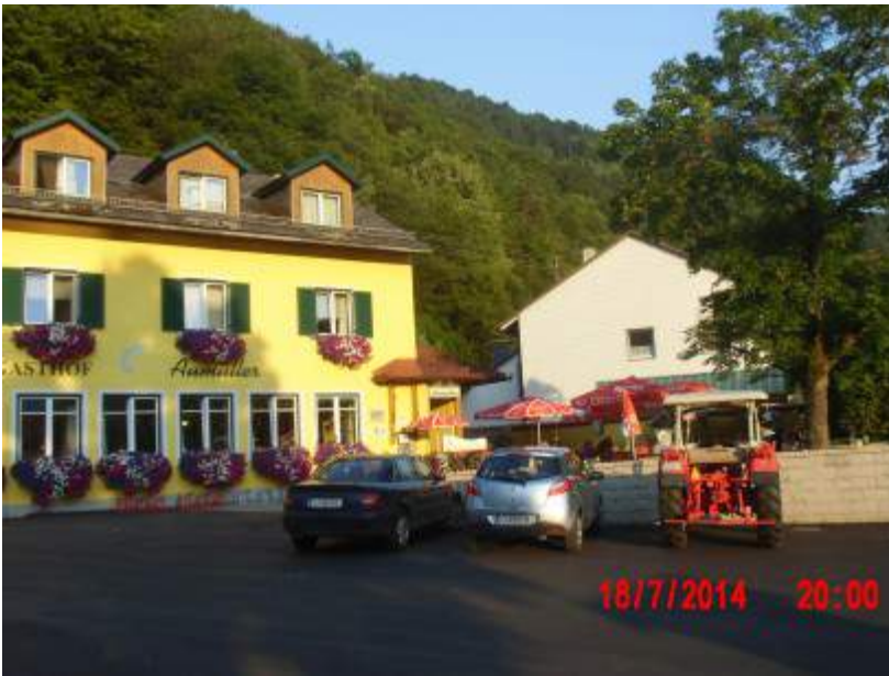
Beim Fischgasthof Aumüller in Obermühl ließen wir es uns gut gehen.