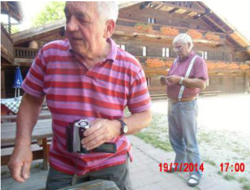
Im Bauernhausmuseum in Massing