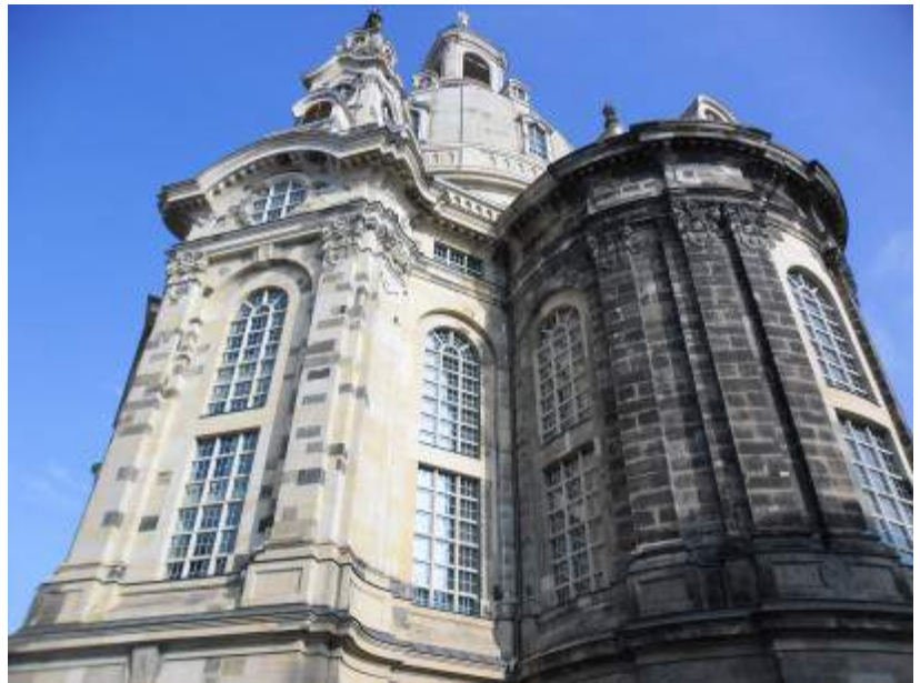
Der erste Blick auf die Frauenkirche