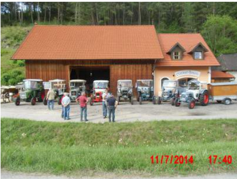
Wir stellten vor dem Vereinsheim und Museum der Oldtimerfreunde Kallmünz unsere Traktoren auf.