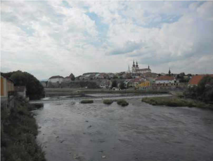
Blick auf Zatek (Saaz)