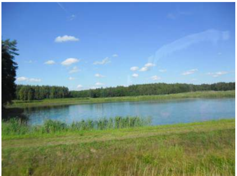
Einer von vielen Karpfenteichen