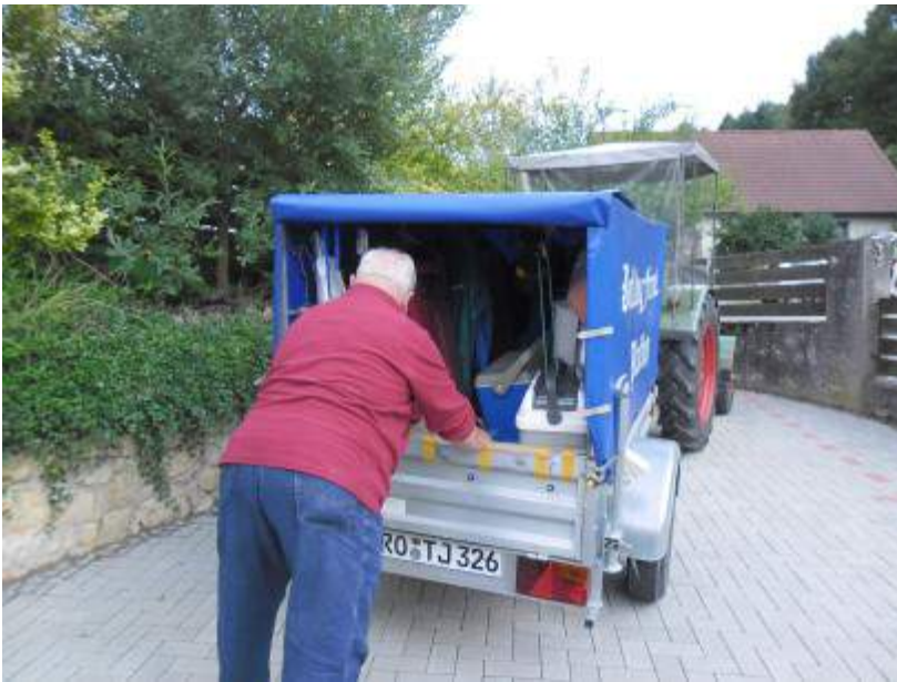
Hansl parkte in Kallmünz bei der Pension „im Malerwinkel“.