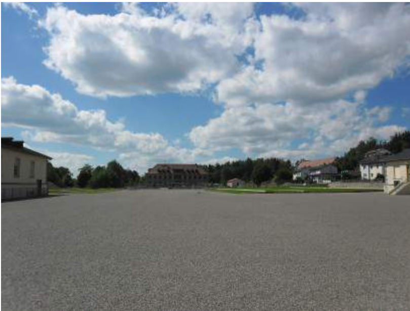
Das KZ Flossenbürg