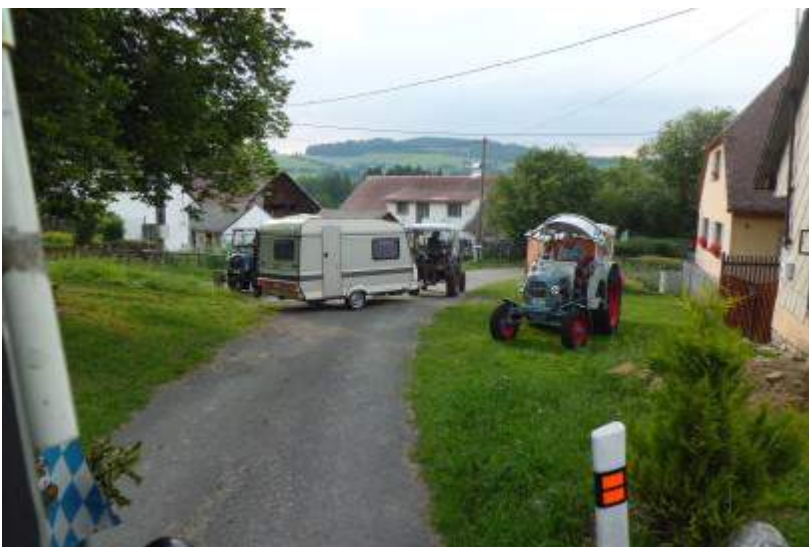
Das Navi hatte uns irregeleitet. Wir mussten umkehren.