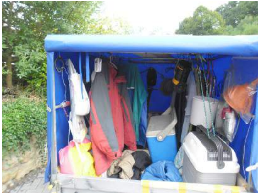
Im Anhänger sieht es fast so aus wie früher im Hausiererwagel.