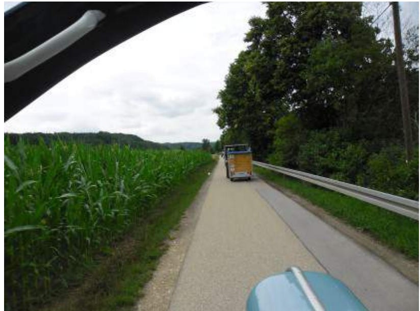
in Richtung Kallmünz