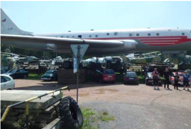
Acht Kilometer nördlich von Pilsen befindet sich in der kleinen Ortschaft Zruc ein privates Flugzeugmuseum.