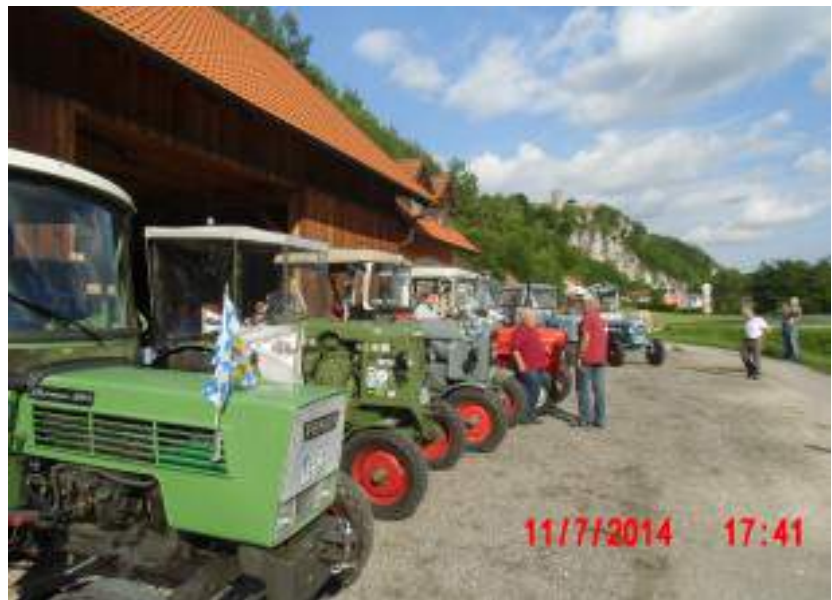
Die Burg Kallmünz im Hintergrund