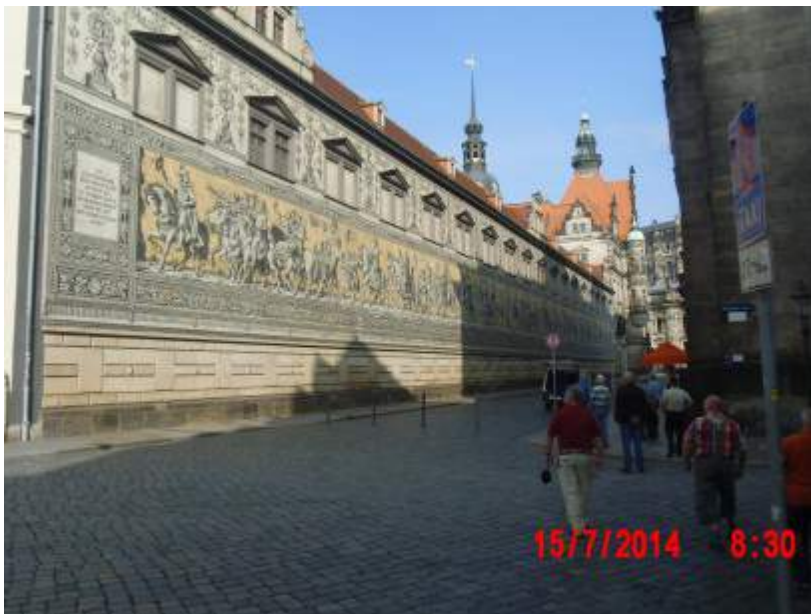
Fürstenzug: 101 m langes Wandbild aus Meissener Porzellankacheln. Dargestellt sind die Herrscher des Hauses Wettin als Reiterzug