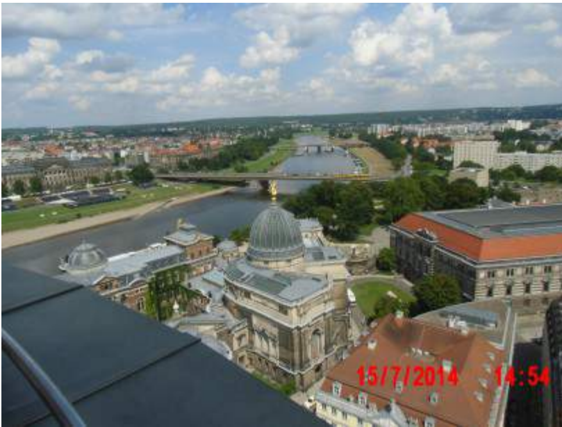
Rundumblick vom Turm der Frauenkirche