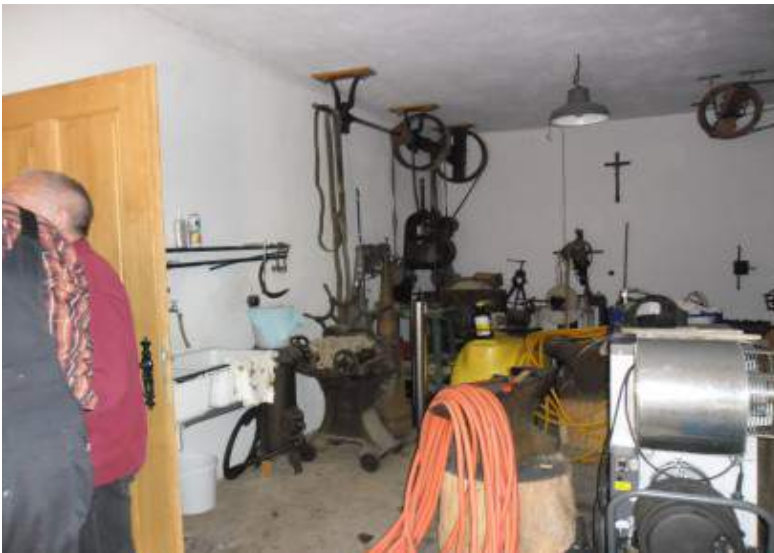
Die Schmiede im Museum